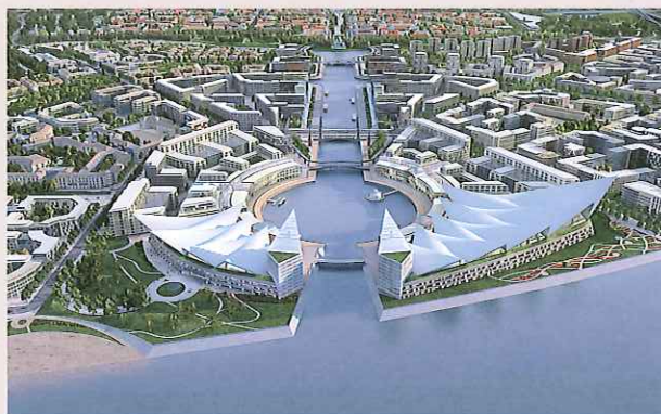
サンクトベルブルク・SZ1計画