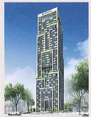
EXIM BANK 本店