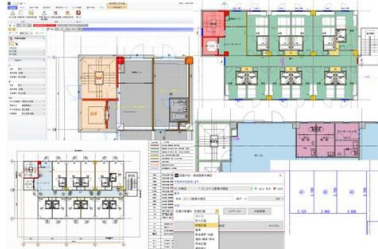
耐火時間を色分け表示