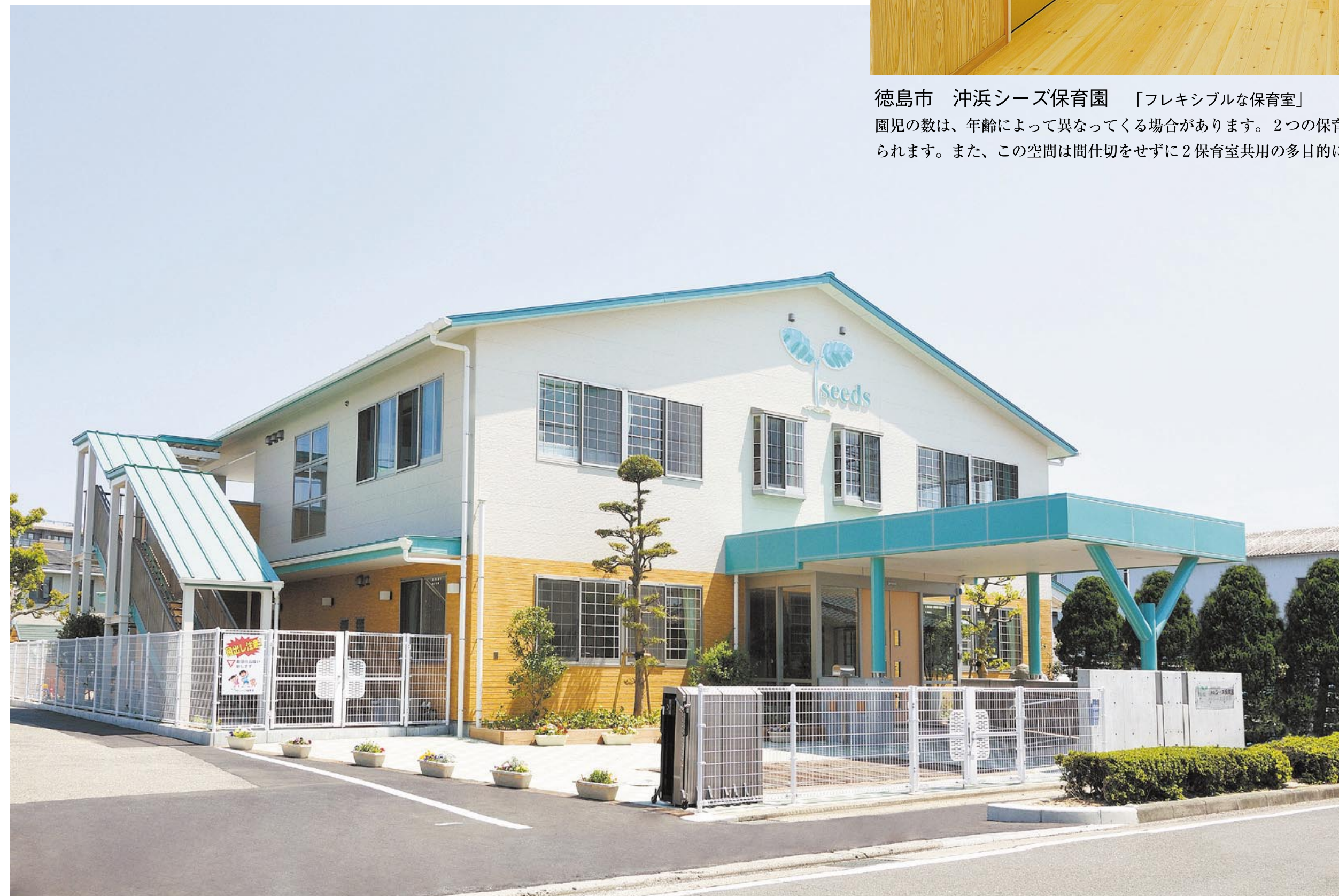
徳島市 沖浜シーズ保育園 「もう一つのおうち」

園児の数は、年齢によって異なってくる場合があります。2つの保育室間に余裕空間を設け、可動間仕切によって部屋の大きさを変えられます。また、この空間は間仕切をせずに2保育室共用の多目的に使用することができ、プログラムに応じて自由に運用できます。