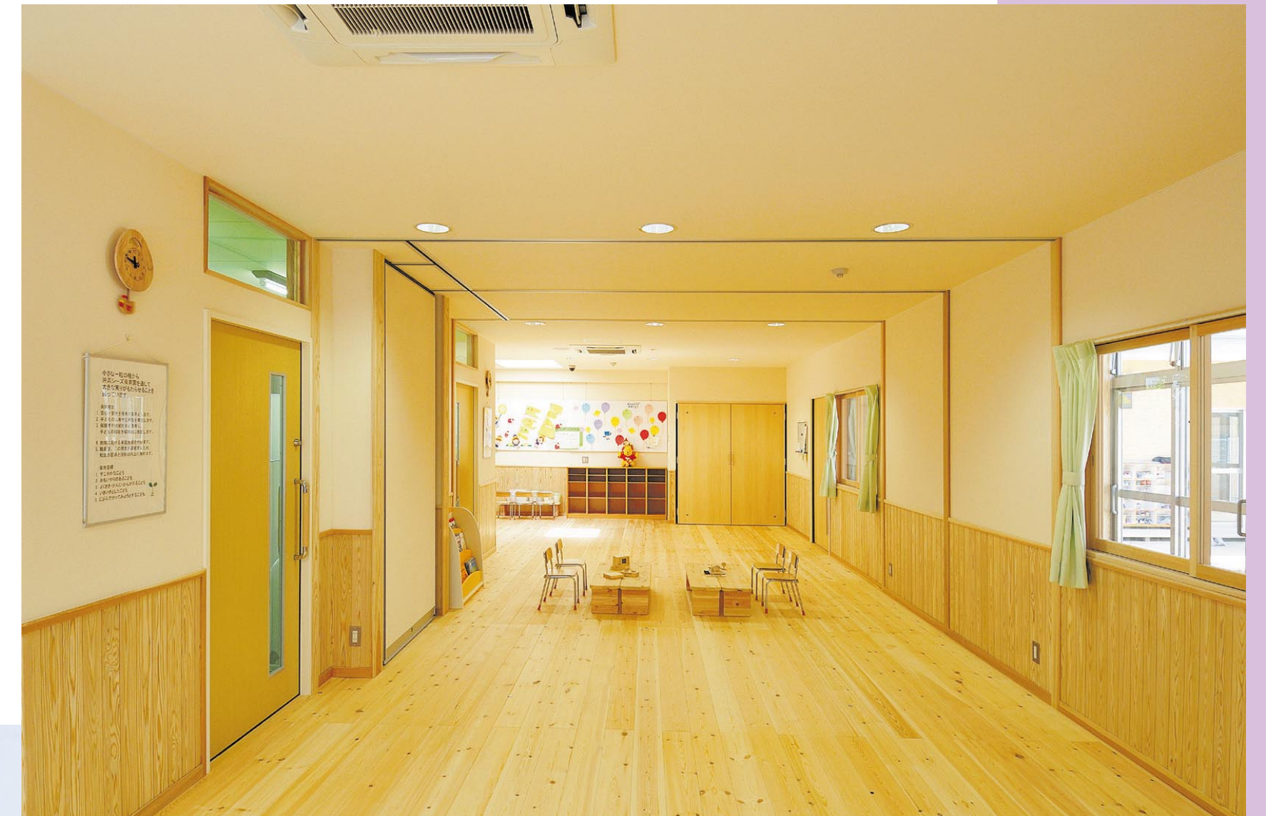
徳島市 沖浜シーズ保育園 「フレキシブルな保育室」

対話を重視し、使う人の立場にたってもものづくりをします。人はそれぞれ、ライフスタイルや育ってきた環境が異なります。それを理解した上で、今ある環境や今後のライフスタイルを踏まえたものづくりの提案をしていきます。また、その地域で培われた伝統工法や素材を取り込むことにより、地域建築の伝承を行っていきます。